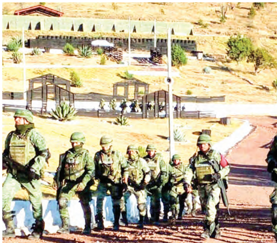
De vergüenza es calificado el comportamiento de los militares.

putos!”, se escucha gritar a los hombres armados con ametralladoras y fusiles, retando a las cuatro patrullas de la Secretaría de la Defensa Nacional (Sedena), una de las instituciones con mayor presupuesto en el Gobierno de López Obrador.