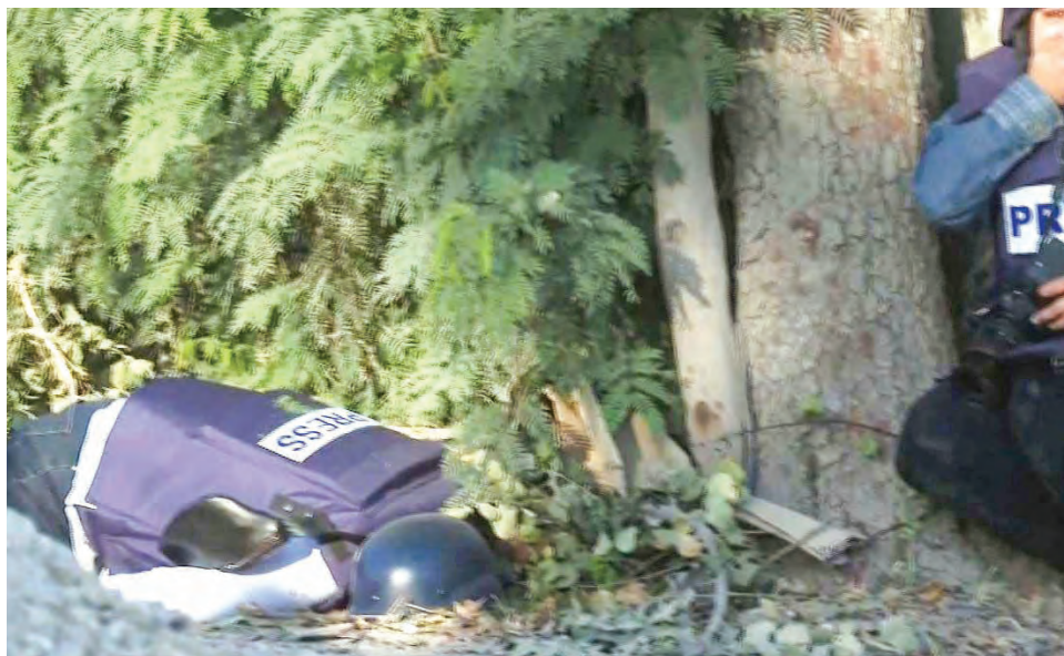
Un video muestra que incluso cuando intentaban rescatar a la reportera, los soldados disparaban.