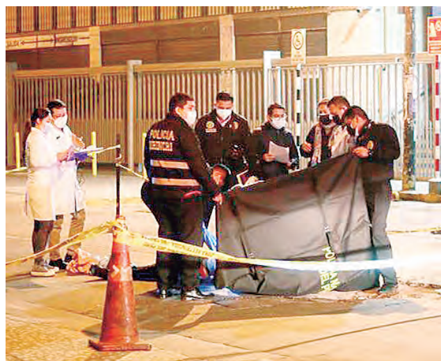
Venezolano fue asesinado en Independencia.

Actualmente se encuentran recluidos 3,307 internos extranjeros, divididos en 3,045 varones y 262 mujeres. Entre los países que tienen mayor población, se encuentra Venezuela (unos 1,500 presos), Colombia y México; entre los países de África y