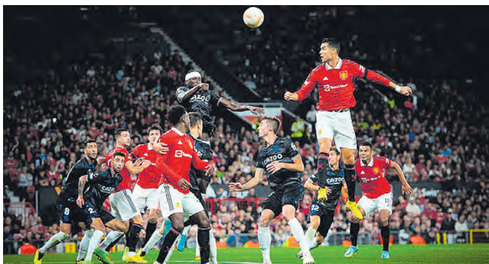
Los de "Old Trafford" en un partido crucial en esta Europa League

VISITAN HOY AL OMONIA DE CHIPRE por la Europa League y necesita el triunfo para pelear el primer lugar del grupo.