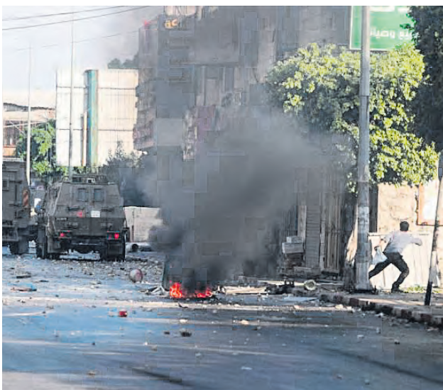
Las incursiones son más frecuentes en los últimos días.

Además, 6 ciudadanos palestinos, entre ellos dos periodistas, fueron baleados, y unos 20 más han sufrido asfixia tras inhalar gases lacrimógenos durante la redada israelí. Las fuerzas israelíes han atacado con balas reales a los equipos de prensa que cubrían el asalto a la localidad, como