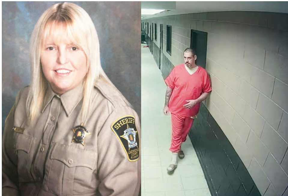
La carcelera luego de salir con el preso, cambió de auto en un centro comercial.

fugarse, en lugar de que la obligaran o coaccionaran.