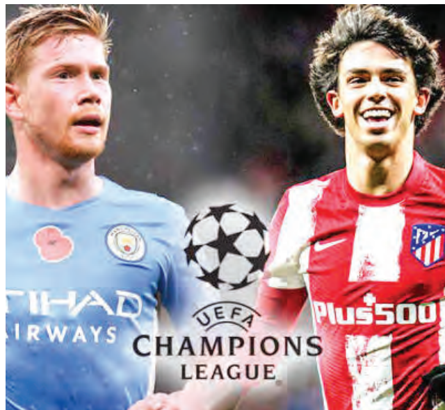
Partido para no perderse desde las 14:00 horas.

El técnico argentino Diego Simeone, también tuvo palabras de elogio sobre su rival. Sostuvo que el gusta mucho el juego del City y alaba el compromiso de todos sus jugadores a la hora de recuperar un balón. Talento y sacrificio según el argentino, son los elementos que todo buen equipo debe tener.