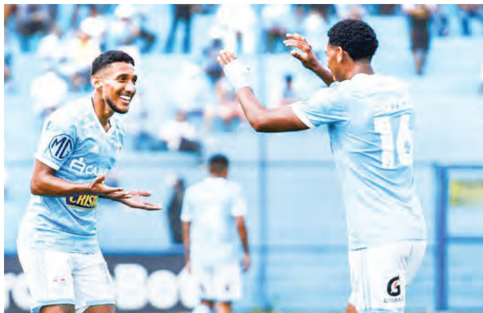
Dura prueba para Cristal en Lima.

Es posible que Mosquera cambie de sistema para enfrentar a